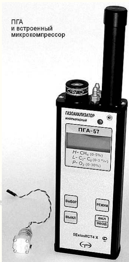
Рисунок 1 – Общий вид газоанализатора