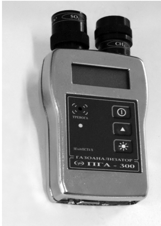
Общий вид ПГА-300 с двумя установленными датчиками