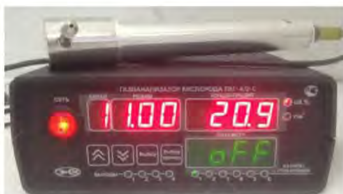
в) исполнение ПКГ-4 /2-С-К-4Р-2А (двухканальный, на фото показан только один измерительный преобразователь)