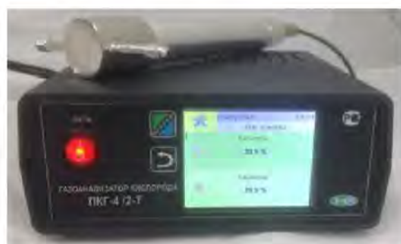
г) исполнение ПКГ-4 /2-Т-К-4Р-2А (двухканальный, на фото показан только один измерительный преобразователь)