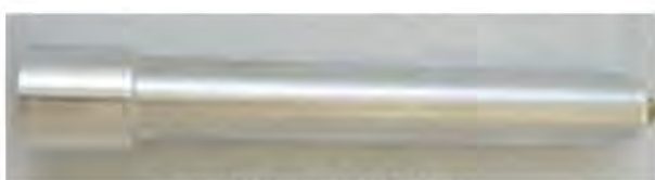
в) ИПК-03, ИПМУ-03