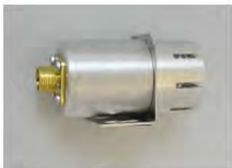
а) ИПК-01, ИПМУ-01