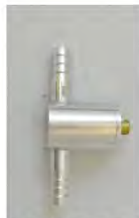
б) ИПК-02, ИПМУ-02