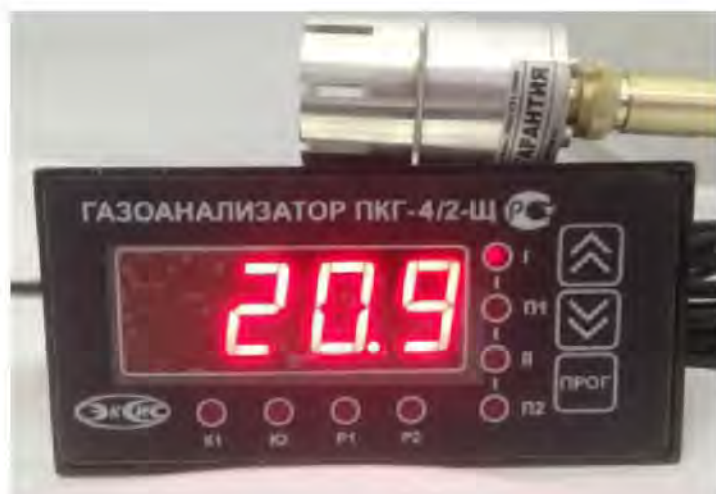
а) исполнение ПКГ-4/2-Щ-К-2Р (одноканальный)