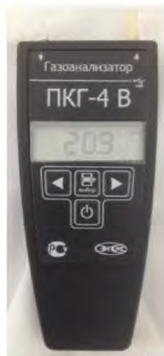
б) исполнение ПКГ-4 В-K-P