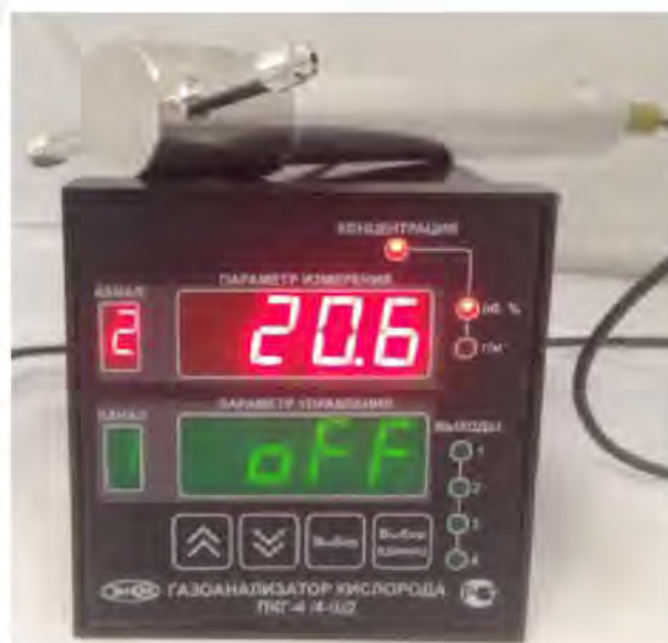
б) исполнение ПКГ-4 /4-Щ2-К-4Р (четырёх-канальный, на фото показан только один измерительный преобразователь)