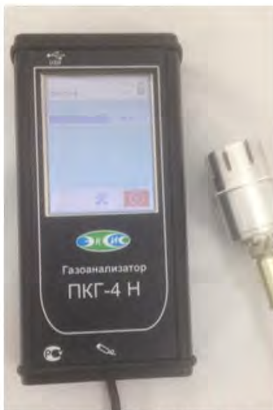
в) исполнение ПКГ-4 Н-К-М-Т