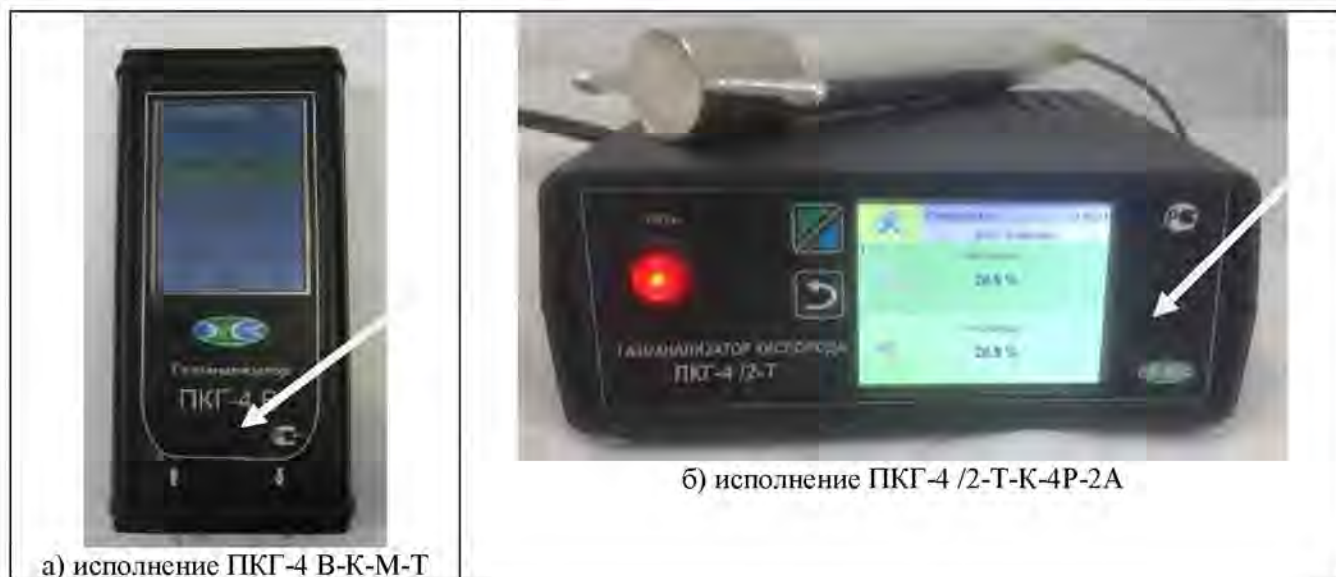
Рисунок 6 – Рекомендуемые места нанесения знака поверки