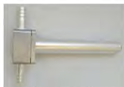
г) ИПК-04, ИПМУ-04