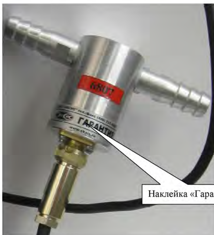
Рисунок 5 – Схема пломбировки выносного измерительного преобразователя