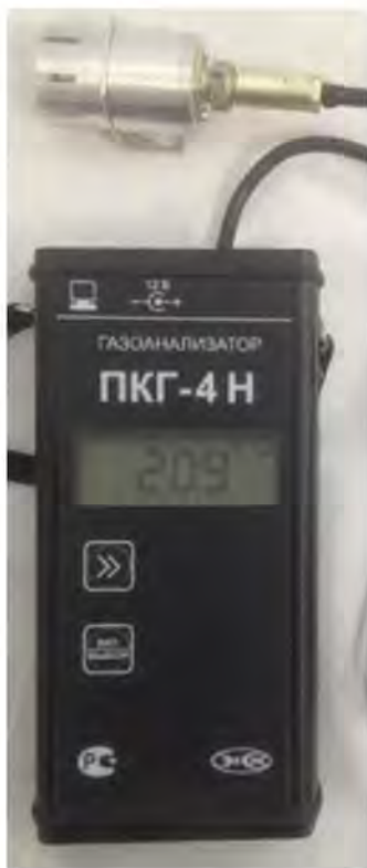
а) исполнение ПКГ-4 Н-К-М