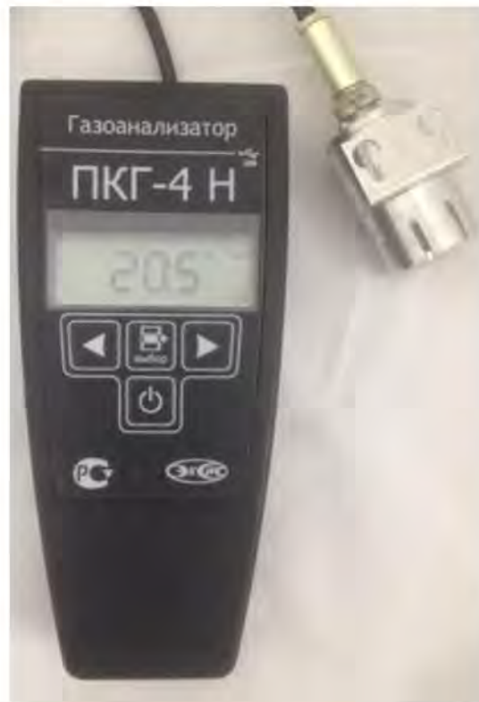
б) исполнение ПКГ-4 Н-К-П