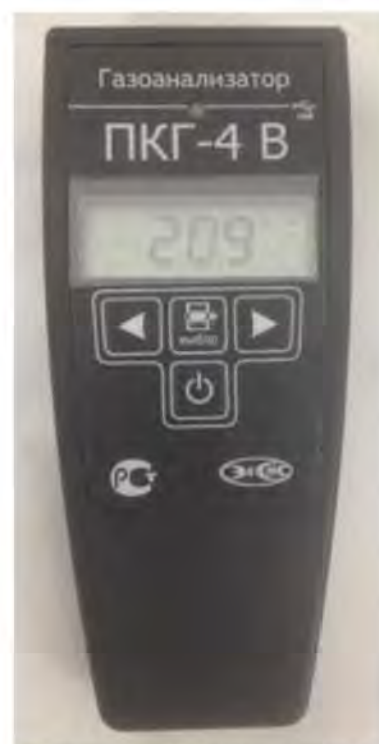
г) исполнение ПКГ-4 В-K-P-D

Рисунок 1 – Газоанализаторы кислорода и оксида углерода ПКГ-4 модификации ПКГ-4 В исполнений ПКГ-4 В-K-M, ПКГ-4 В-K-P, ПКГ-4 В-K-M-T, ПКГ-4 В-K-P-D, внешний вид (исполнения ПКГ-4 В-SO-M, ПКГ-4 В-SO-P, ПКГ-4 В-SO-M-T, ПКГ-4 В-SO-P-D имеют аналогичный внешний вид и отличаются маркировкой на шильдике и показаниями на дисплее)